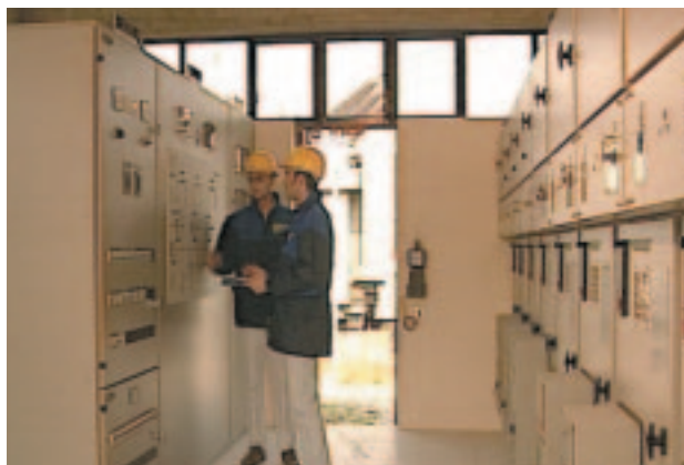
cabina in sottostazione

siamo partners abituali di importanti industrie del settore siderurgico, alimentare, farmaceutico sia per nuove installazioni elettriche, che per manutenzione straordinaria e revamping.