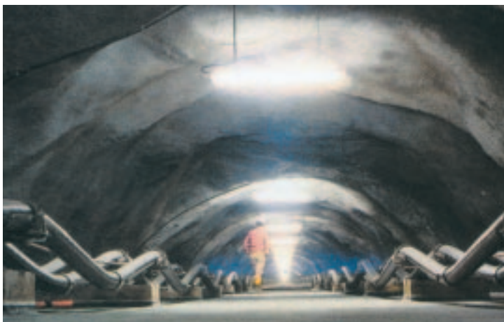
centrale idroelettrica di generazione e pompaggio potenza max 1.000 MW ENEL EDOLO BS due terne di cavi a 400 kV festonate lungo la galleria per compensare la dilatazione termica

abbiamo partecipato alla realizzazione di alcuni tra i principali impianti di energia elettrica per conto di ENEL e collaborato con i maggiori contractors fornitori di apparecchi elettrici (ABB - MAGRINI - ALSTOM).