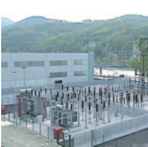
sistema A.T. 132 kV e M.T. 15/11,5 kV 72 MVA centrale di cogenerazione

abbiamo realizzato stazioni e sottostazioni di trasmissione e distribuzione di energia elettrica per l'ENEL e per utenze private.