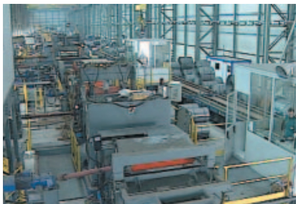
linea di decapaggio