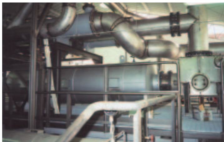
centrale di cogenerazione 1700 KVA per CARBOTERMO OSPEDALE MAGGIORE DI PADOVA

operiamo anche nel terziario per realizzare impianti idonei a molteplici servizi.