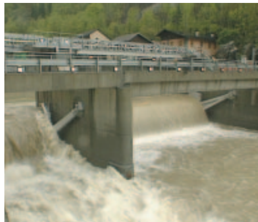
opera di presa centrale idroelettrica VARZO II° BATTIGIO VB