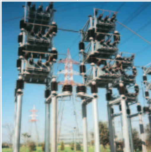
batterie di rifasamento da 54 MVAR 132 KV TERNA BOVISIO MI