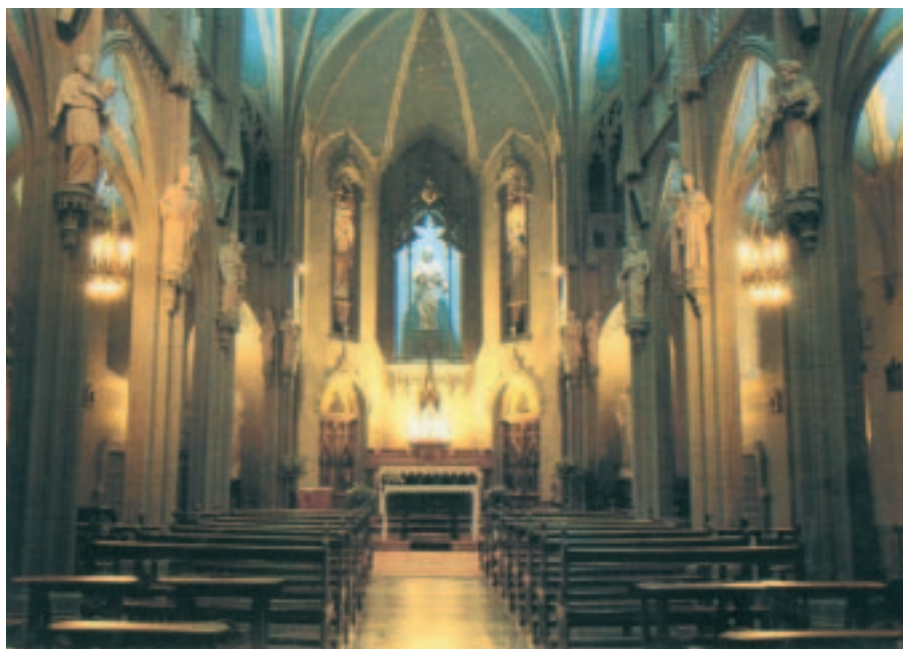
chiesa ISTITUTO COLONNA MI

ci occupiamo dell'adeguamento degli impianti elettrici alla Legge 46/90 e relativo regolamento di attuazione DPR 447/91, del rifacimento di impianti e dell'illuminazione di edifici monumentali, della fornitura di impianti di messa a terra e protezione dalle scariche atmosferiche.